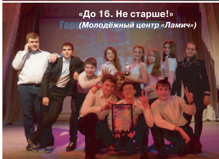
«До 16. Не старше!» (Молодёжный центр «Ламич»)